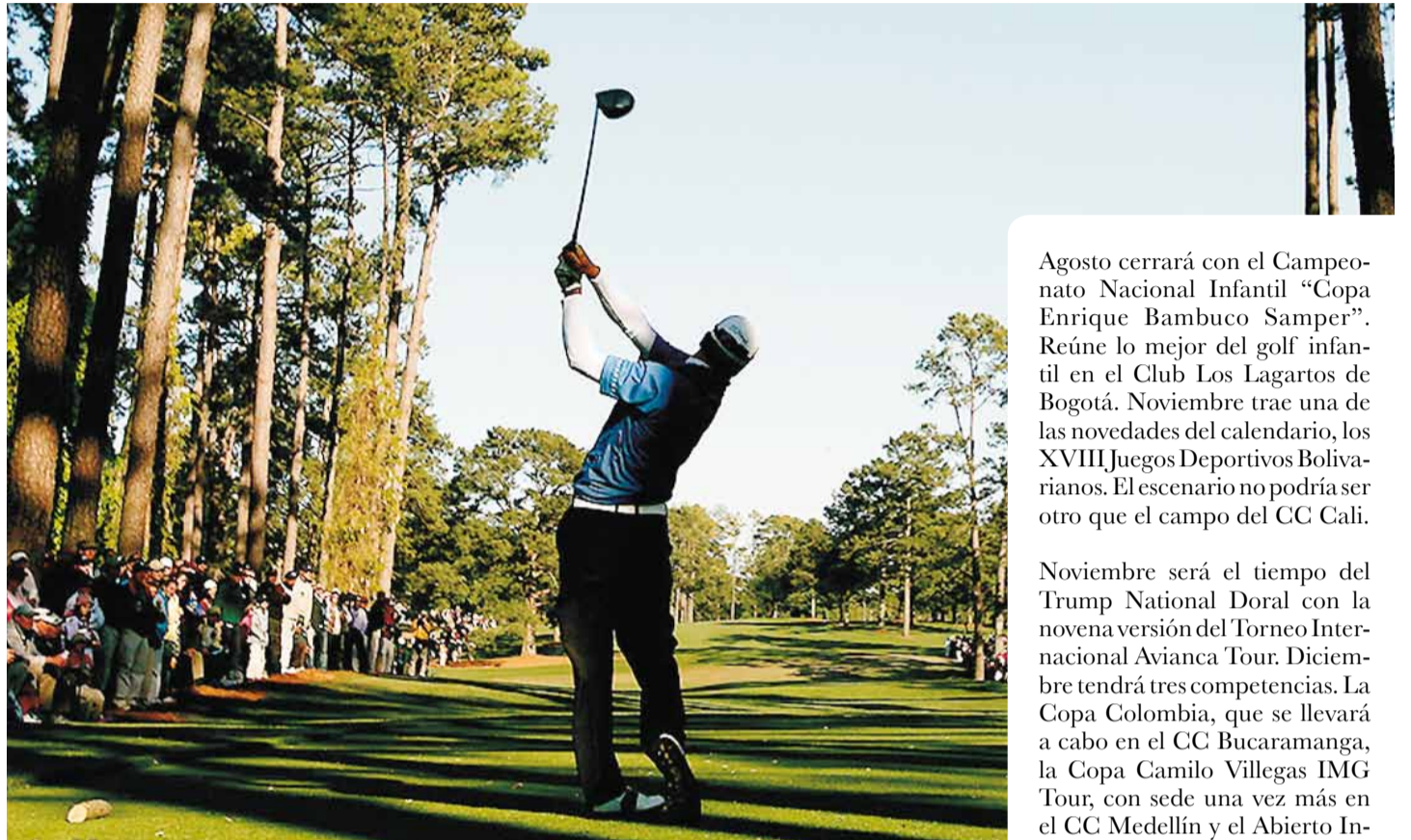
En el presente año se esperan intensas jornadas de competencias del golf colombiano. Una temporada para tener en cuenta.

Torneos profesionales, de mayores e infantiles cubrirán todos los segmentos del golf en el país.