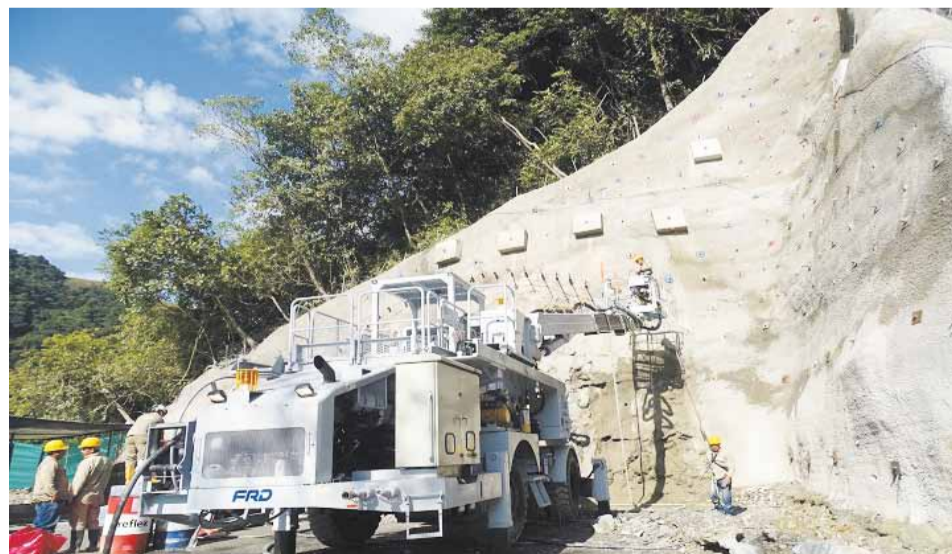
Sigue la instalación de los arcos tipo cercha, como parte constitutiva de la excavación sub-terránea y presoporte y la construcción de piscinas de sedimentación para el manejo de aguas industriales.

Comenzó la excavación del túnel 1, una obra que estará ubicada entre Chirajara y el retorno. La nueva calzada Chirajara-Villavicencio, con cobertura para los departamentos de Cundinamarca y Meta, tiene una longitud origen-destino de 22,60 kilómetros y de desarrollo 32,08 kilómetros, distancia en la cual los usuarios disfrutarán de 16 puentes y 7 túneles, obras de infraestructura que acercan