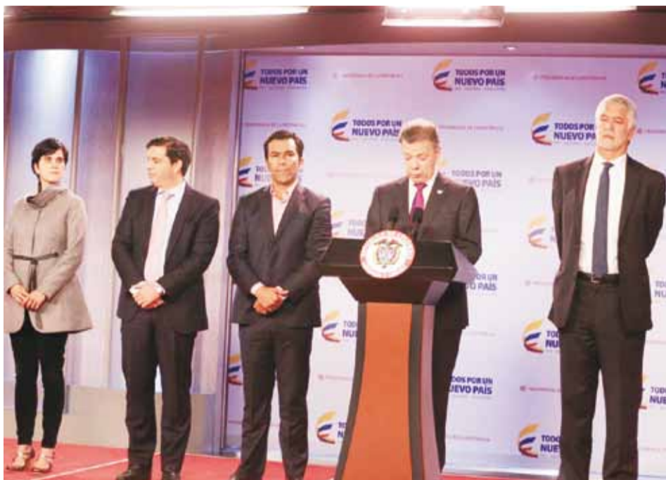
La obra tendrá 41 km. de vía férrea, de los cuales 15 km. urbanos en Bogotá y en lo que se contemplan 12 estaciones y 26 km. en la zona suburbana con 6 estaciones.

Con este proyecto se movilizarán aproximadamente 211.000 pasajeros al día y se