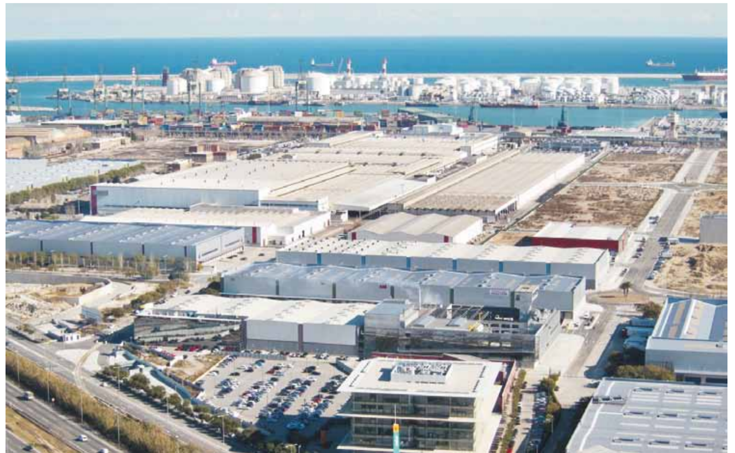
“Con la normatividad actual se regula la totalidad del proceso de declaratoria de existencia de nuevas zonas francas, así como el trámite de ampliación, de extensión y reducción de las áreas declaradas como tales”.

En la parte de operaciones se regula puntualmente el asunto de mercancías procedentes de otros países, denominándolo destino aduanero; de mercancías del territorio nacional a zona franca y calificándolo como una exportación definitiva, salvo las excepciones consagradas en el propio Decreto. También, las salidas de zona franca al resto del mundo y al resto del territorio nacional, así como las operaciones entre zonas. Importante una nueva limitación que el decreto establece para el procesamiento parcial (no puede ser superior a 40 por ciento del costo de la producción de los bienes o servicios en el año fiscal), la cual deberá ser reglamentada por la