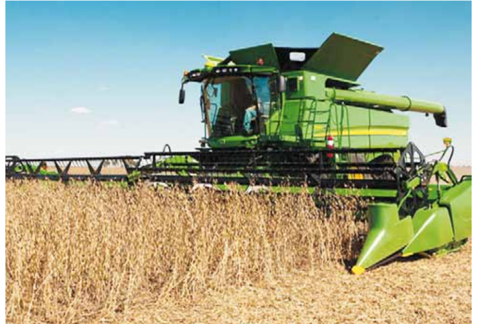
La aplicación de esta medida ha permitido importar 6.000 millones de dólares en bienes desde mercados con los cuales Colombia no tiene acuerdos comerciales vigentes.

Así se estimula la actividad productiva en subsectores como las confecciones,