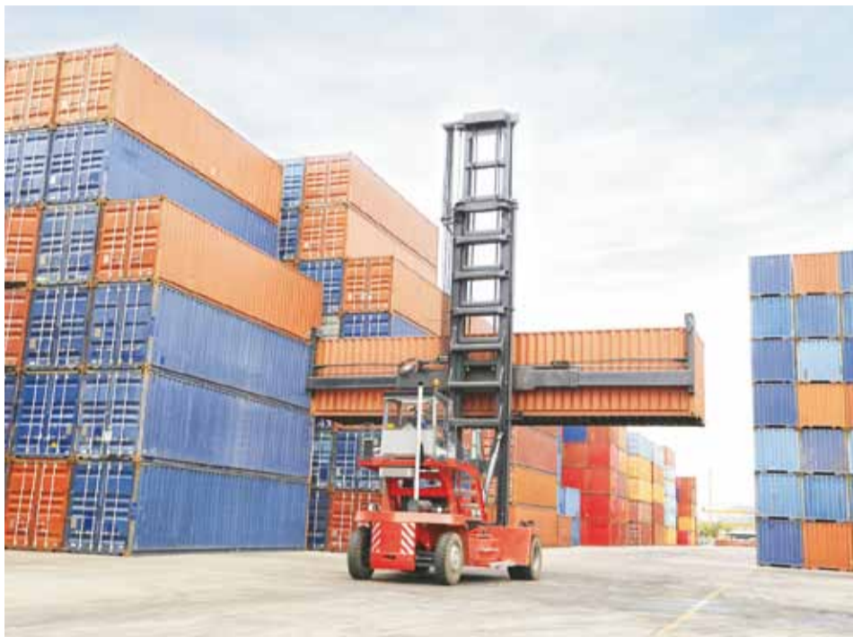
Desde el 18 de diciembre de 2015, cuando el Ministerio de Comercio, Industria y Turismo asumió nuevamente la administración del Plan Vallejo, estaba en manos de la Dian, 12 empresas solicitaron ingresar al Plan. Hoy son 469.

Entre los bienes de capital que entran a formar parte del Plan Vallejo se destacan: envases de aluminio para el transporte de leche, generadores de vapor, bombas para hormigón, máquinas y aparatos