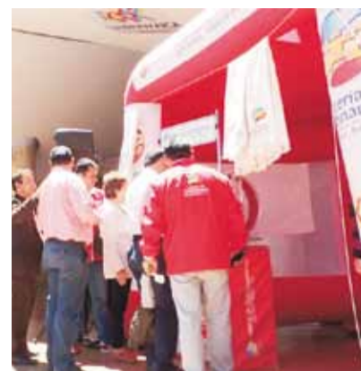
La entidad entregó premios por 20 millones de pesos.

La Lotería de Cundinamarca transfirió al sector salud 21.000 millones de pesos durante la vigencia 2016, fruto de la venta del producto. Para lograr estos resultados la Entidad adelantó estrategias de venta y de posicionamiento en regiones, lo que permitió otorgar premios a los ganadores por más de 20.000 millones de pesos.