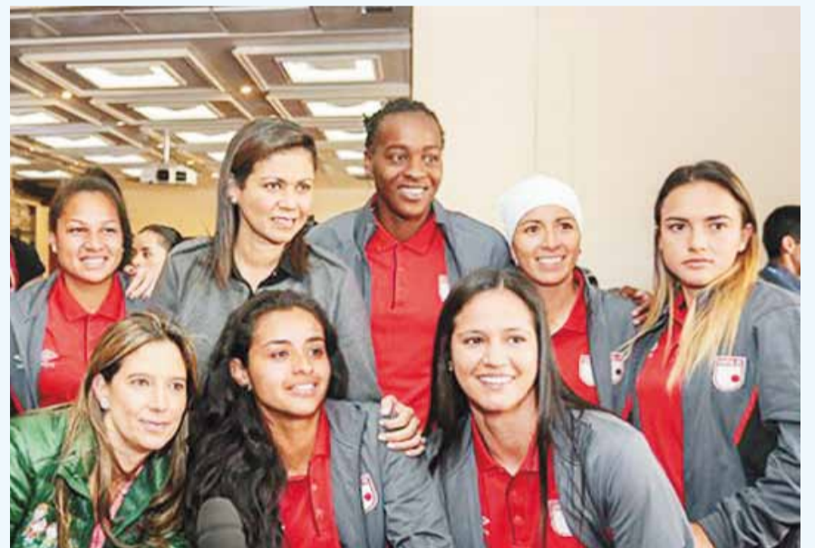
Grupo de jugadoras que será parte en 2015 del primer campeonato profesional de fútbol femenino que ya deja gran expectativa entre la afición.

Desde el 15 de febrero, cuando fue lanzada oficialmente, comenzó a operar en Colombia la Liga Profesional Femenina de Fútbol y para el efecto, la Federación Internacional de Fútbol Asociado (FIFA), envió un mensaje.