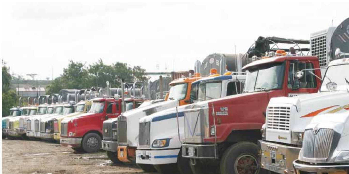
De tractocamiones, o “tractomulas” como se les conoce, sólo se matricularon 4 unidades en enero del 2017.

A los gremios del comercio y de la industria les preocupa que cada año baje la compra de vehículos de carga, pues por las carreteras se moviliza la mayoría de la producción nacional.