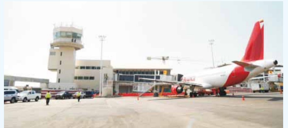
En marcha plan de modernización de la terminal.

El aeropuerto tiene hoy en operación la torre de control nueva, el parqueadero subterráneo, la ampliación de la plataforma y el edificio de la terminal