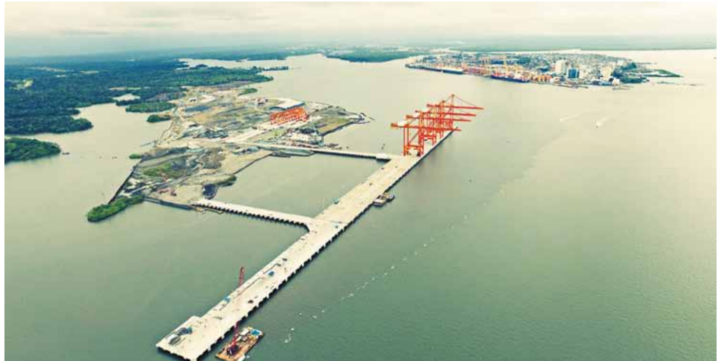
El Puerto Industrial Multipropósito de Aguadulce beneficiará a los empresarios colombianos por los menores costos de transporte y a los internacionales por una infraestructura montada con la más moderna tecnología”.

El Puerto Industrial de Aguadulce se convierte en una de las obras de infraestructura de mayor importancia para el sector portuario en Colombia. Esto debido a la confianza y compromiso con el crecimiento y la competitividad de la región y el país por parte de sus dos principales socios asiáticos: Ictsi de Filipinas con más de 30 puertos en 21 países y PSA Internacional de Singapur, con 40 terminales portuarias en 16 países. Se espera que esta terminal, ubicada en el corazón del Pacífico colombiano se consolide como una de las más grandes y eficientes de la región.