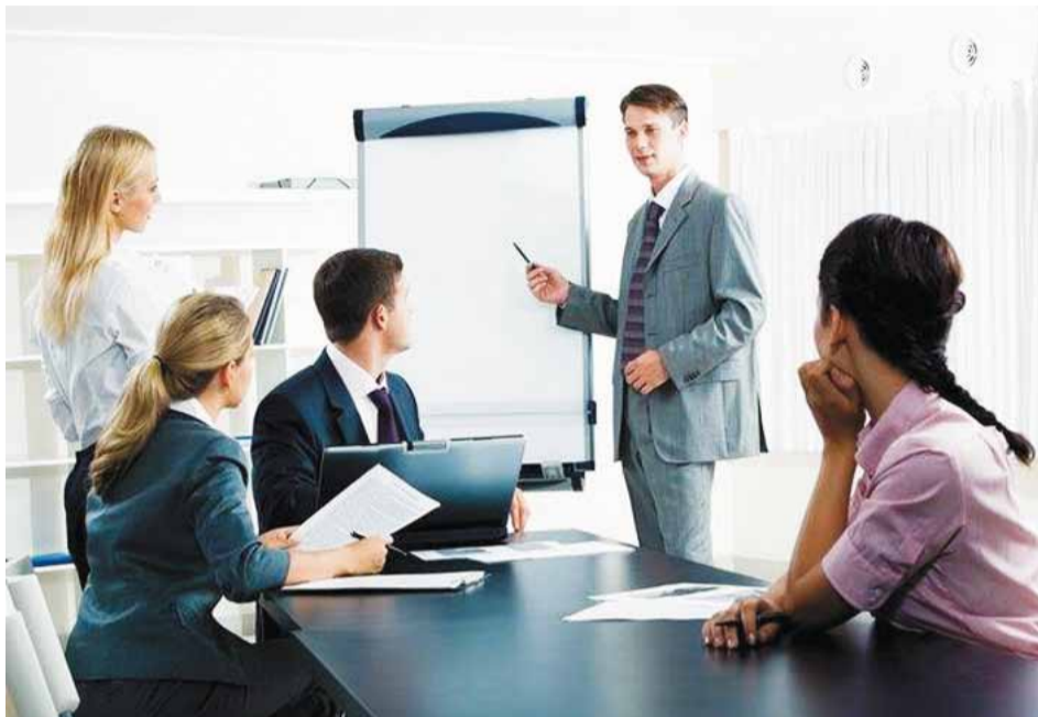
Este fenómeno se debe tres razones: ventas insuficientes, escases de procesos administrativos y falta de experiencia de los socios.

1. Entorno económico y social. Las variables externas, tales como los aspectos económicos, legales y tributarios, pueden sellar el destino de un negocio basado en franquicias. Aspectos como la reciente