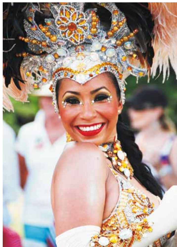
Felicidad y colorido en los actos que se programan.

Es una de las fiestas más grandes del Caribe, dura cuatro semanas con fiestas en la calle llamadas "jump-ups", desfiles y actos musicales.