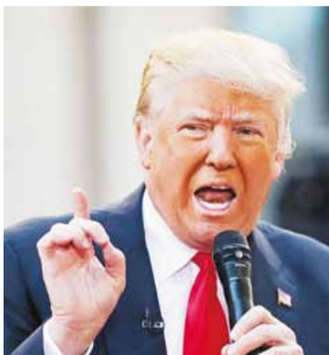
Donald Trump, presidente de los Estados Unidos de América.

Donald Trump ha permitido ver en twitter algo de lo que será su presidencia con respecto a Rusia, China y México, pero no se sabe mucho sobre Colombia. Por esto, autoridades, gremios y analistas están a la expectativa. A Javier Díaz Molina, presidente ejecutivo de la Asociación Nacional de Comercio Exterior (Analdex), le preocupa la política proteccionista de Trump, lo cual va en contravía de los intereses de Colombia en cuanto a que las empresas prefieran localizarse en Estados Unidos y a la inversión.